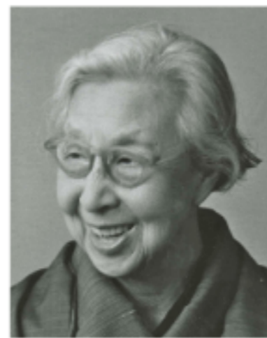
平塚らいてう 女性運動家