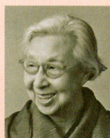
平塚らいてう 女性運動家